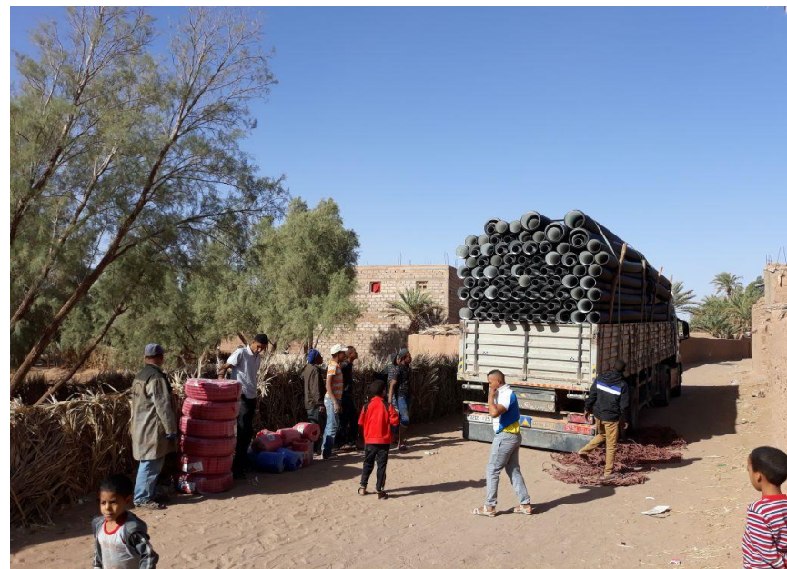
Acopio de materiales