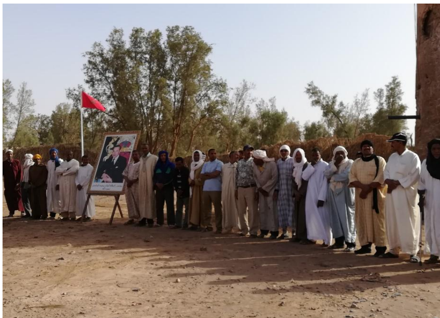
Acto oficial de comienzo de las obras