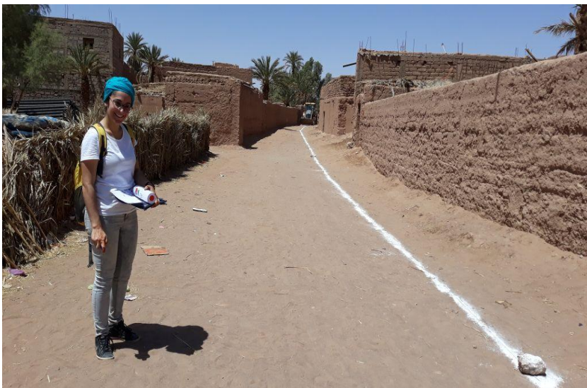
Arquitecta desplazada a M'HAMID Dirección facultativa de la obra