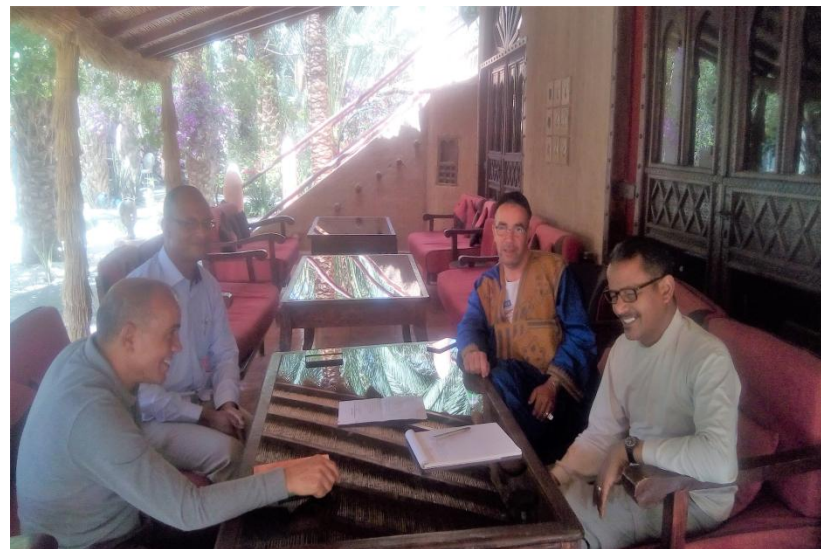
Rotarios del RC de Zagora Supervisión por el club Rotario Local