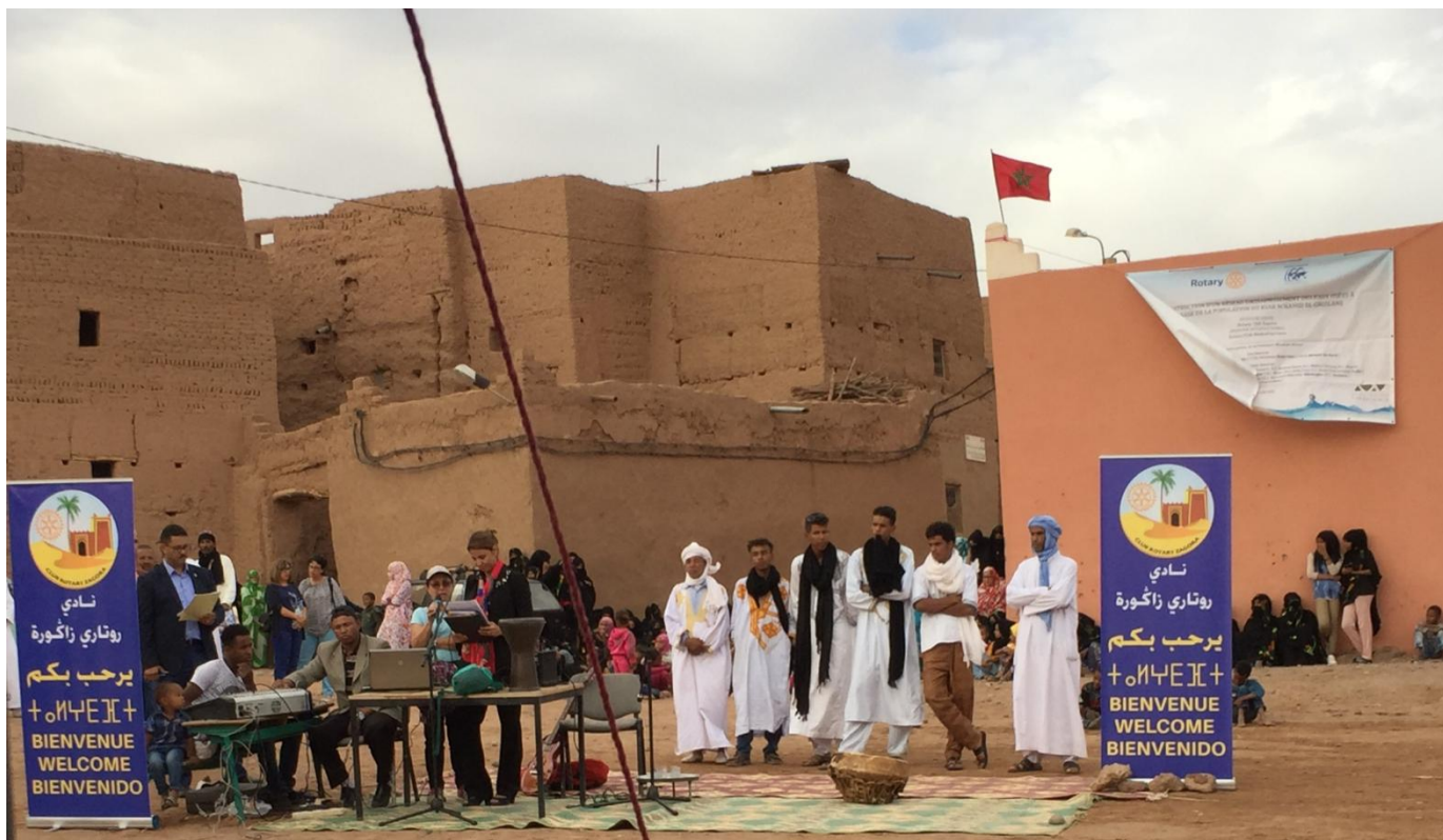
Acto oficial con el RC de Zagora ...